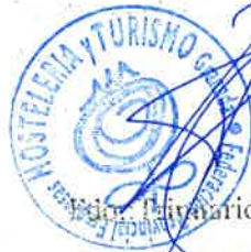
Fdo.: Iñakiario Betoret Catalá